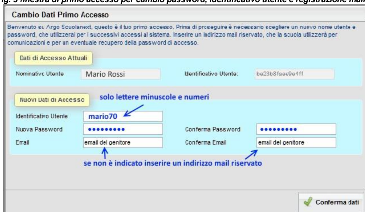
Fig. 3 finestra di primo accesso per cambio password, identificativo utente e registrazione mail.

Dopo aver digitato tutti i dati richiesti, cliccare su " Conferma dati ", a questo punto il sistema avviserà dell'avvenuta registrazione dei dati e provvederà ad inviare una mail di promemoria al vostro indirizzo e.mail.