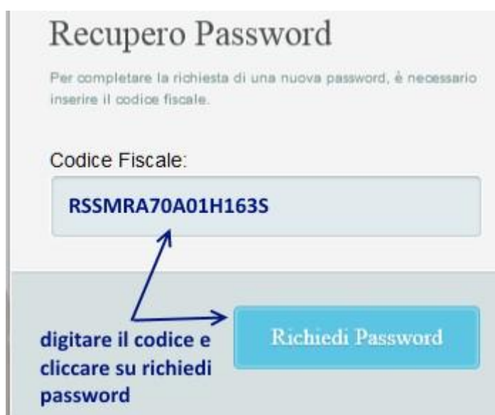
Fig. 7 recupero password ulteriore conferma digitazione del codice fiscale

Per una ulteriore verifica di sicurezza il sistema chiederà di digitare il codice fiscale dell'utente.